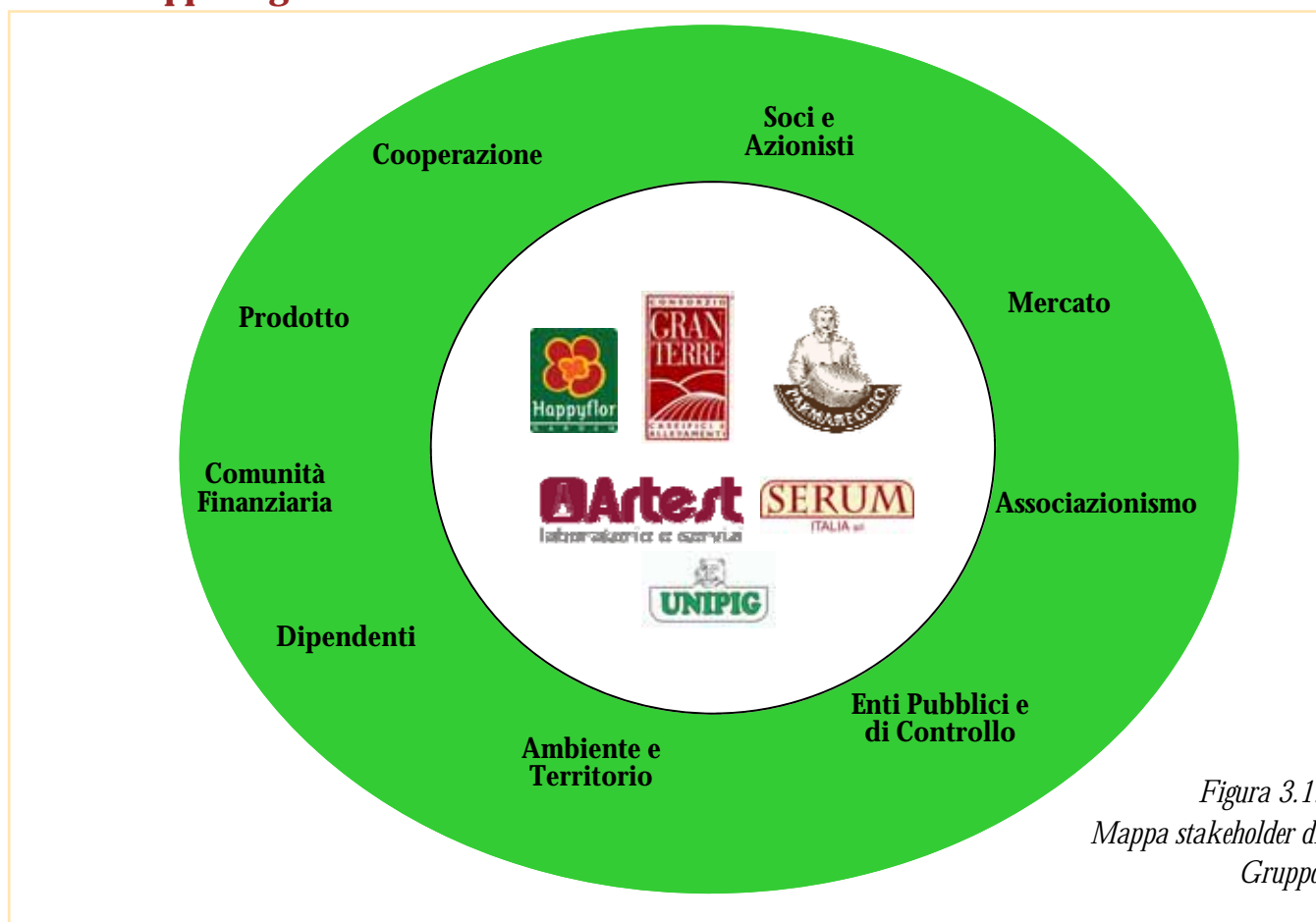
Figura 3.1: Mappa stakeholder di Gruppo

Il Gruppo Granterre crede che ciò che fa e soprattutto perché decida di farlo o di non farlo, debba essere estremamente chiaro a tutte le categorie di Stakeholder. Questo Codice si propone di diffondere quei valori cari alla tradizione ed alla cultura aziendali, ispirazione per tutte le decisioni che sono state assunte e per quelle che lo saranno nel futuro.